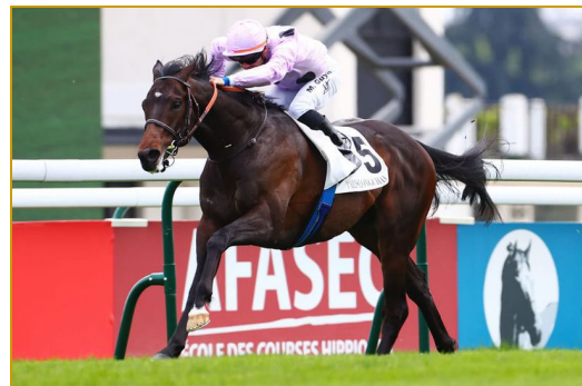
Winter Pudding (Seahenge), vendu yearling à La Teste en 2021, gagnant du Prix de l'Avre L. Sa demi-sœur par Al Wukair passera en vente le 12 septembre à La Teste, lot 121.

Le catalogue est en ligne sur www.osarus.com et sera disponible en version papier à partir du 27 juillet.