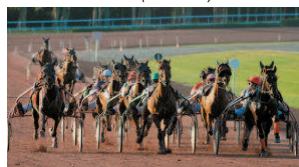
Quinté+ à Vincenne - 13.00