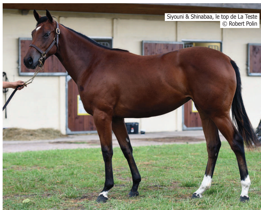
Siyouni & Shinabaa, le top de La Teste