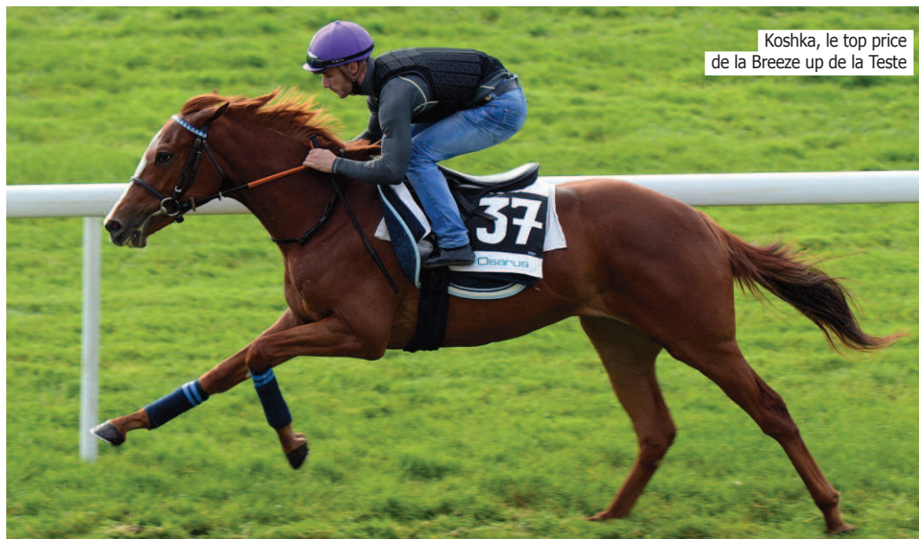
Koshka, le top price de la Breeze up de la Teste

Osarus clôture sa saison de ventes 2015 avec un résultat en légère baisse (- 1,7 %). Le chiffre d'affaires global passe de 5.858.750 euros en 2014 à 5.757.750 euros en 2015. Sur 657 lots présentés, 463 chevaux ont changé de mains, soit 70,5 %.